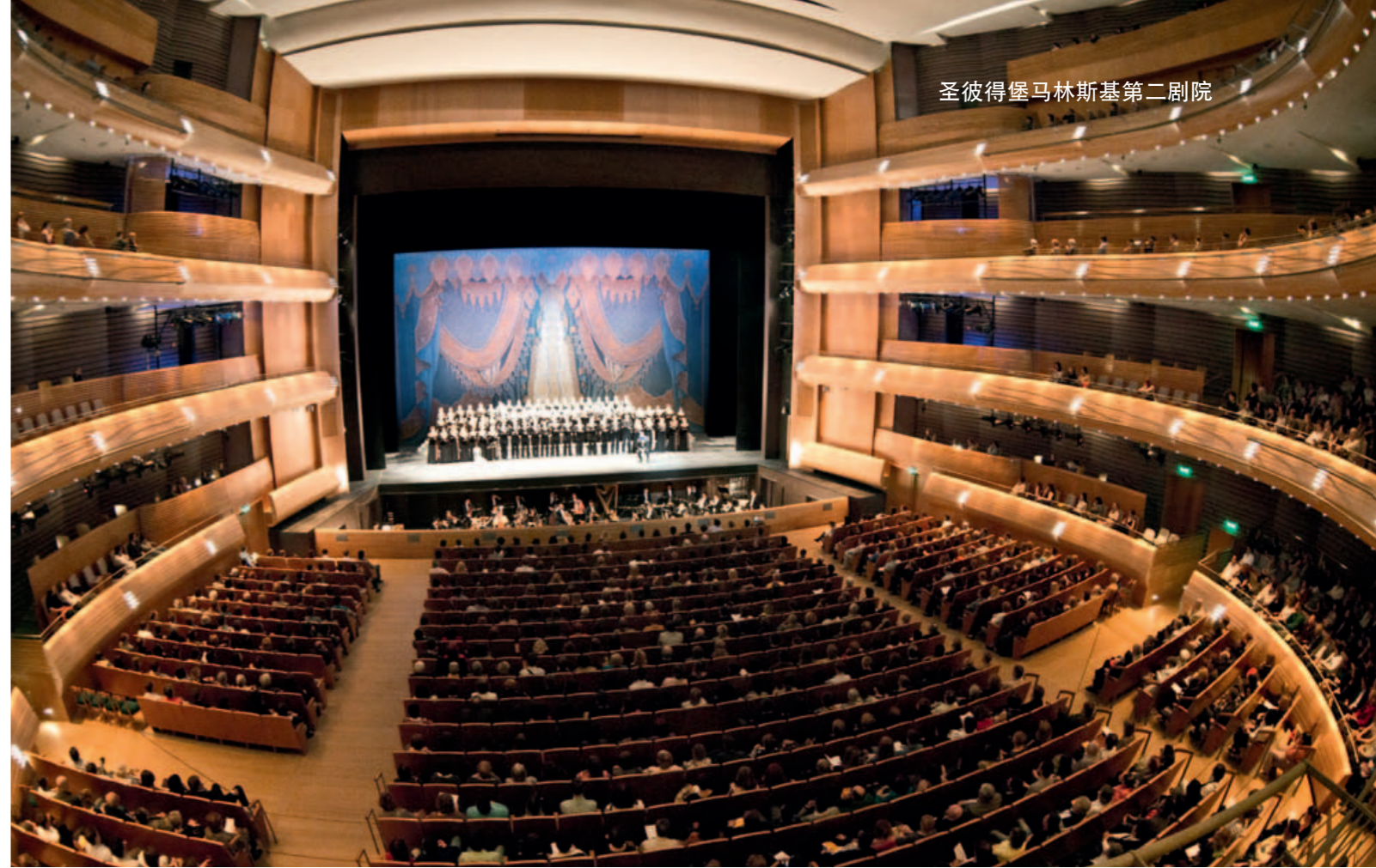
圣彼得堡马林斯基第二剧院