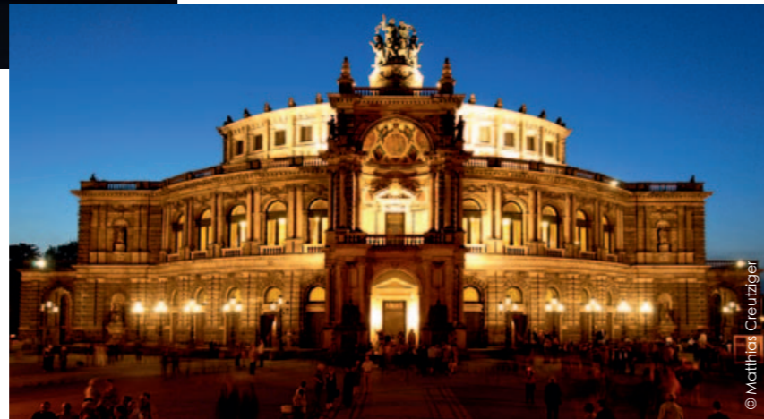
《阿斯塔纳国家歌剧芭蕾舞剧院》

1985年，在二战中遭到毁坏后的40年，德累斯顿森帕歌剧院重新开放并按照历史原貌结合现代舞台技术进行了修葺。直至今日我们都是这家高品味歌剧院的合作伙伴，在过去的几十年中对其进行了多次修复和保养。